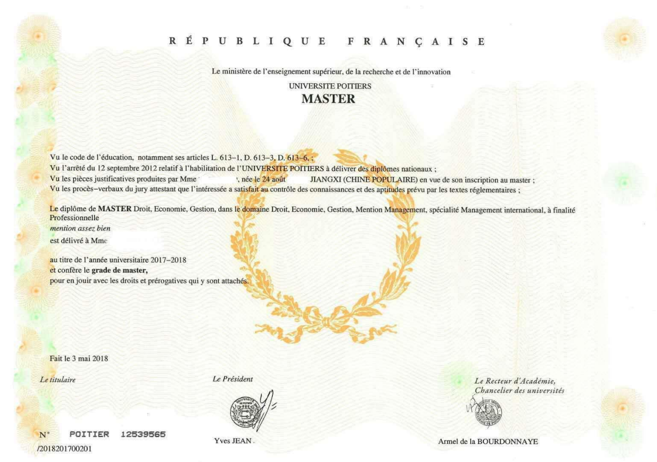
法国普瓦提埃大学国际企业管理硕士学位证书样本（法国国家文凭）