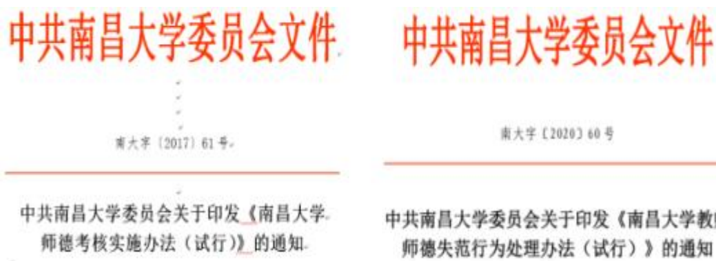
图 2 南昌大学强化师德师风建设相关文件

(2) 注重教师的党建工作，“三师三课三全”引航学生成长成才。院系领导定期给 MPAcc 导师及任课教师上党课，引导党员教师进一步坚定理想信念，提高党性觉悟。